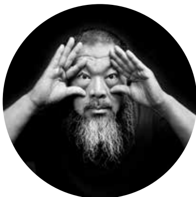
Konstnären Ai Weiwei

En utställning med verk från 1600-tal till nutid. I utställningen får du se 400 år gamla vetenskapliga illustrationer sida vid sida med moderna verk som gestaltar vår tids utmaningar kring ekologi, klimat och de massiva utrotningar av djur som sker nu.