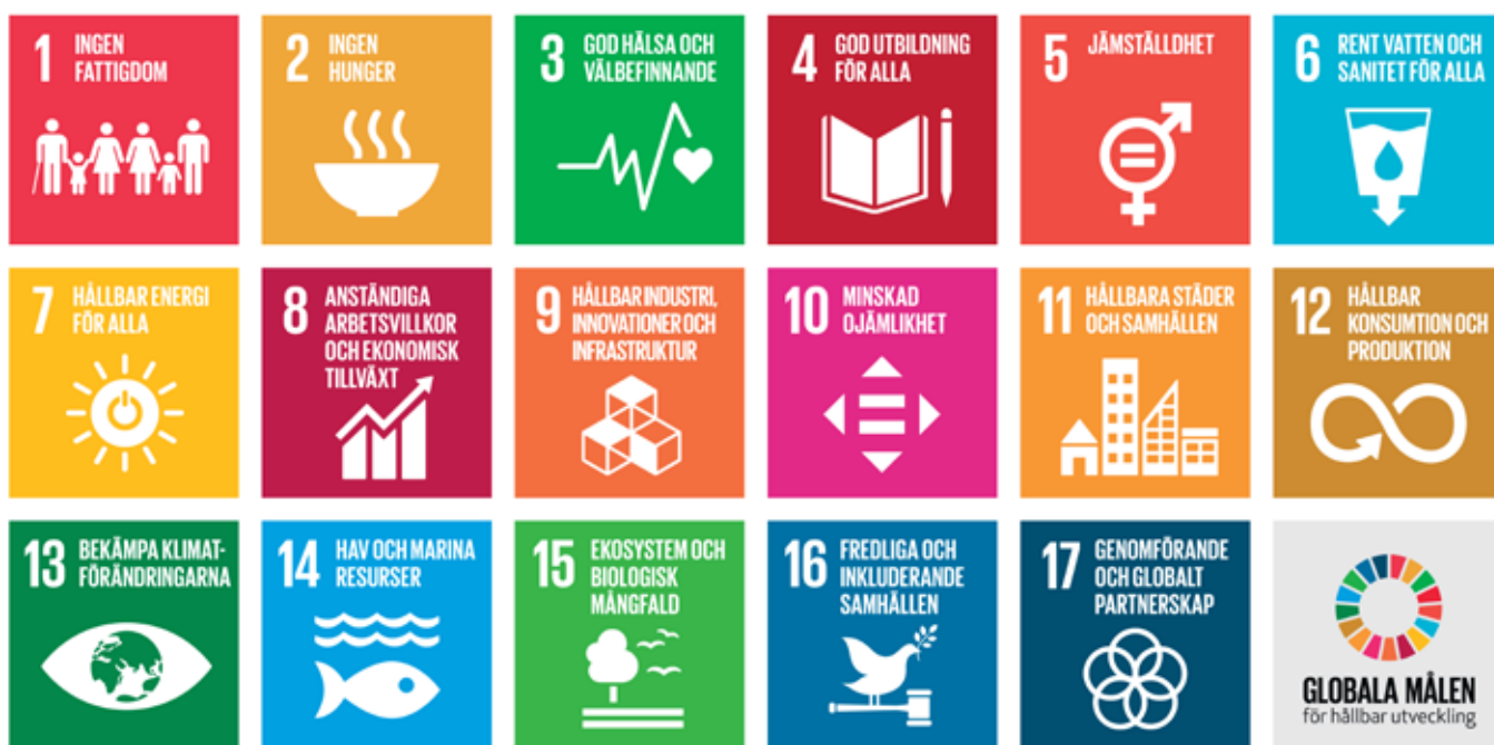
Alla 17 globala mål som FN beslutade om 2015: Agenda 2030